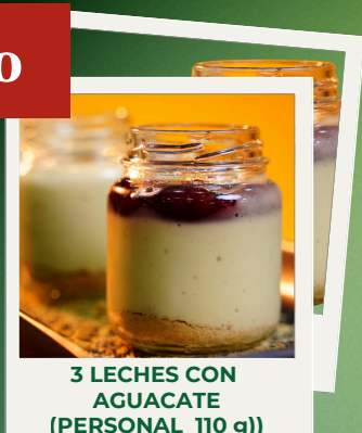
3 LECHE CON AGUACATE (PERSONAL 110 g)