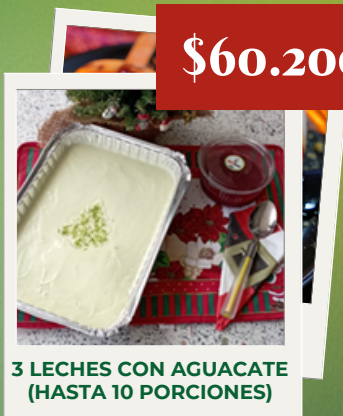
3 LECHE CON AGUACATE (HASTA 10 PORCIONES)