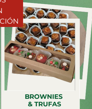
BROWNIES & TRUFAS